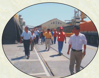
Recorrido por las instalaciones del terminal portuario TISUR. Matarani, 19-02-09