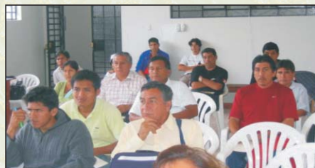
Asistentes al evento "La tala y el comercio ilegal de maderas". Tingo María, 29-02-2008