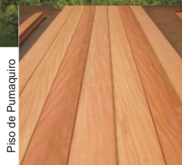
Piso de Pumaquiro

calcular los futuros volúmenes de madera por especie y planificar con anticipación las actividades en la industria forestal.