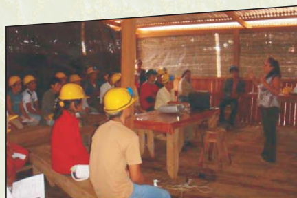
Curso de capacitación "Certificación forestal y seguridad industrial". Puerto Maldonado, 16-05-09