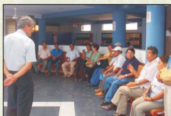
Visita a las instalaciones de CETICOS Matarani. 19-02-09