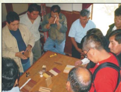
Participantes identificando maderas en el Curso Taller "Identificación y cubicación de especies de madera aserrada". Arequipa, 28-05-09