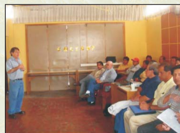
Rueda de Negocios en Arequipa. 16-02-09