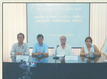
Panel de representantes de ONUDI, COFIDE, PRODUCE y CITE-Madera, Primer Encuentro Maderero de la Macro Región Sur. Ilo, 17-02-09