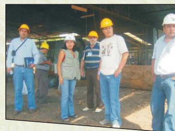
Visita de campo a empresas forestales en Puerto Maldonado. 12-08-2008