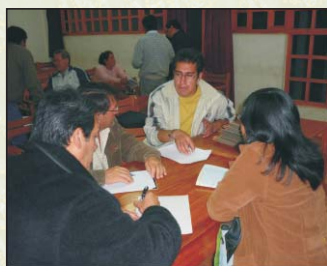
Reuniones grupales para intercambio de información. Rueda de negocios. Cusco, 20-02-09