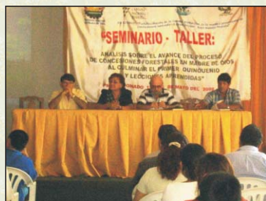
Evento "Análisis sobre el avance del proceso de concesiones forestales en Madre de Dios al culminar el primer quinquenio". Puerto Maldonado, 15 y 16 de mayo 2008