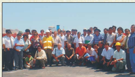
Delegaciones de Cusco, Madre de Dios, Arequipa y Moquegua en el Muelle de ENAPU. Ilo, 18-02-09