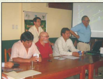
Representantes de CETICOS ILO, CECYCAP y la CNF en la Mesa Redonda "Dinamización de la cadena productiva de la madera con fines de exportación de la macro región sur a través de CETICOS ILO". Puerto Maldonado, 08-08-2008