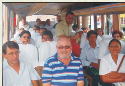
Delegaciones participantes rumbo a las instalaciones de CETICOS ILO. Moquegua, 18-02-09