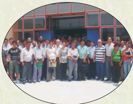
Participantes en el Primer Encuentro Maderero de la Macro Región Sur. Ilo, 17 y 18 de febrero 2009